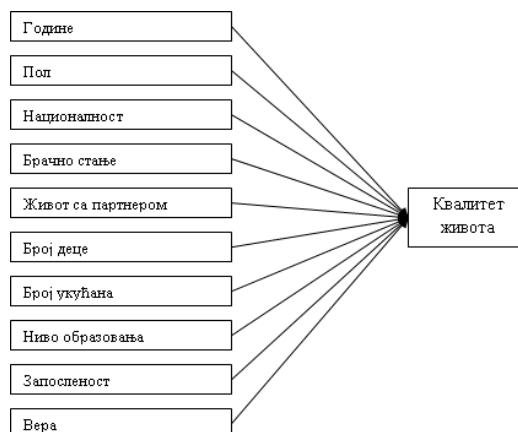
Slika 1. Strukturni model za razmatranje socio-demografskih varijabli

Zadovoljstvo sopstvenim životom u kom trenutku vremena, tokom dana, tokom meseca, tokom godine, tokom čitavog života? Šta je zaista realno i to pod uslovom da je osoba/osobe iskrena? Iz ovoga sledi da je zadovoljstvo sopstvenim životom dinamička veličina i da je u korelaciji sa vremenom, okruženjem i unutrašnjim stanjem čoveka. Jako uprošćen prikaz istorije života jedne osobe dat je na Slici 2. U skladu sa tim, uočljive su karakteristične faza života, a sa njima i promene ciljeva i structure zadovoljstva sopstvenim životom. Zapravo šta bi bilo zadovoljstvo sopstvenim životom jednog čoveka, ako ne zbir njegovih zadovoljstava odnosno nezadovoljstava tokom celokupnog njegovog života. Tako se dolazi do veoma kompleksnog problema, posmatranog